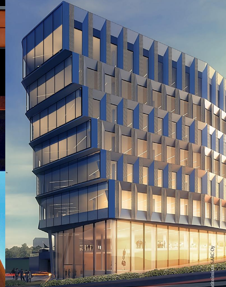
Kuva: Arkkitehtitoimisto SARCO Oy