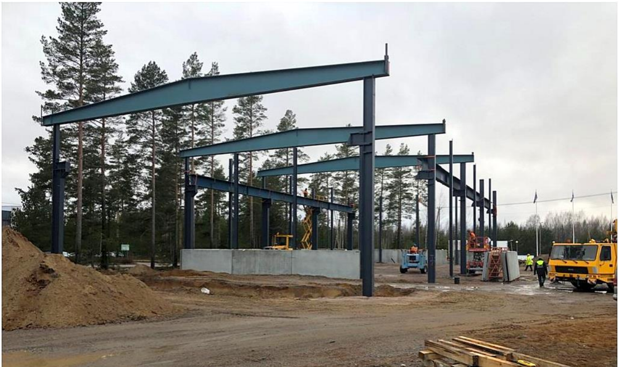
Kuva 4. Runkorakenteiden asennusta uuteen käyttökohteeseen [34].

Lamminpään aluehanke Tampereella palkittiin Vuoden Purkuhankkeena 2022. Alueelta purettiin yhteensä 15 kiinteistöä, joista suurin osa oli teollisuuskiinteistöjä. Purkukohteissa pyrittiin mahdollisimman paljon toteuttamaan ehjänä purkua ja rakenneosien uudelleenkäyttöä; kantaville teräs-rakenteille löydettiin uudet käyttökohdet rakennettaviin teollisuushalleihin (esimerkki kuvassa 4). Hankkeessa kehitettiin rakennusten ja rakennusosien digitaalisen materiaalipassin edellyttämiä työkaluja ja prosesseja sekä tuotettiin myös lisätietoa uusien rakennusten suunnitteluun ja alkuperäisten rakennusosien jäljitettävyyteen. Osalle Lamminpäässä puretuista halleista luotiin digitaaliset 3D-tietomallit uudelleenkäyttöä varten. Rakenneseisiin liitettiin myös RFID-tagit, joihin liitettiin tietoa kustakin purettavasta rakennusosasta ja joiden sisältämä tieto vietiin digitaaliseen materiaali-datapankkiin uudelleenkäyttöä silmällä pitäen. Datapankin tiedot ovat arkkitehtien ja suunnittelijoiden käytettävissä ja sen avulla voidaan purkaa uudelleenkäytön esteitä; monet arkkitehdit pelkäävät hyödyntää käytettyjä osia, koska ei ole tietoa siitä, missä kunnossa osat ovat ja missä niitä on käytetty. Digitaalinen materiaalipassi lisää uudelleenkäyttömahdollisuuksia selvästi. [34].