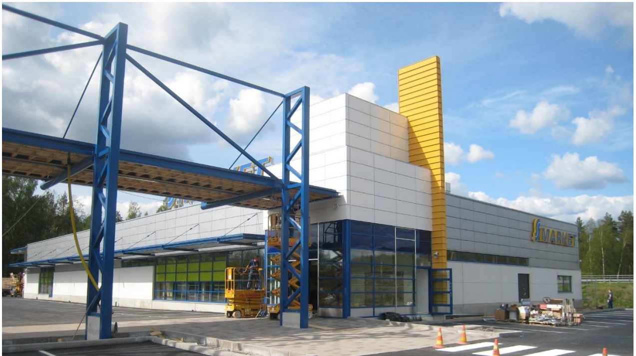
Kuva 3. S-Market Urjalan valmistunut rakennus [31].

Helsingin Hernesaaresta purettiin vuosina 2018-2019 suuri Wärtsilän telakkahallina toiminut Merihalli-niminen teräsrunkoinen rakennuskokonaisuus, josta uudelleenkäyttöön siirtyi runsaasti runkorakenteita, teräspalkistoa, nostureita, nosturiratoja ja sähkötekniikkaa [32]. Kestobetoni Oy löysi Lahteen suunniteltuun betonielementtitehtaan laajennushankkeeseen Merihallista teräsrunгон pilarit, palkit, kattotuolit, nosturiradat ja viisi siltanosturia, joihin uusittiin koneistot. Laajennus-