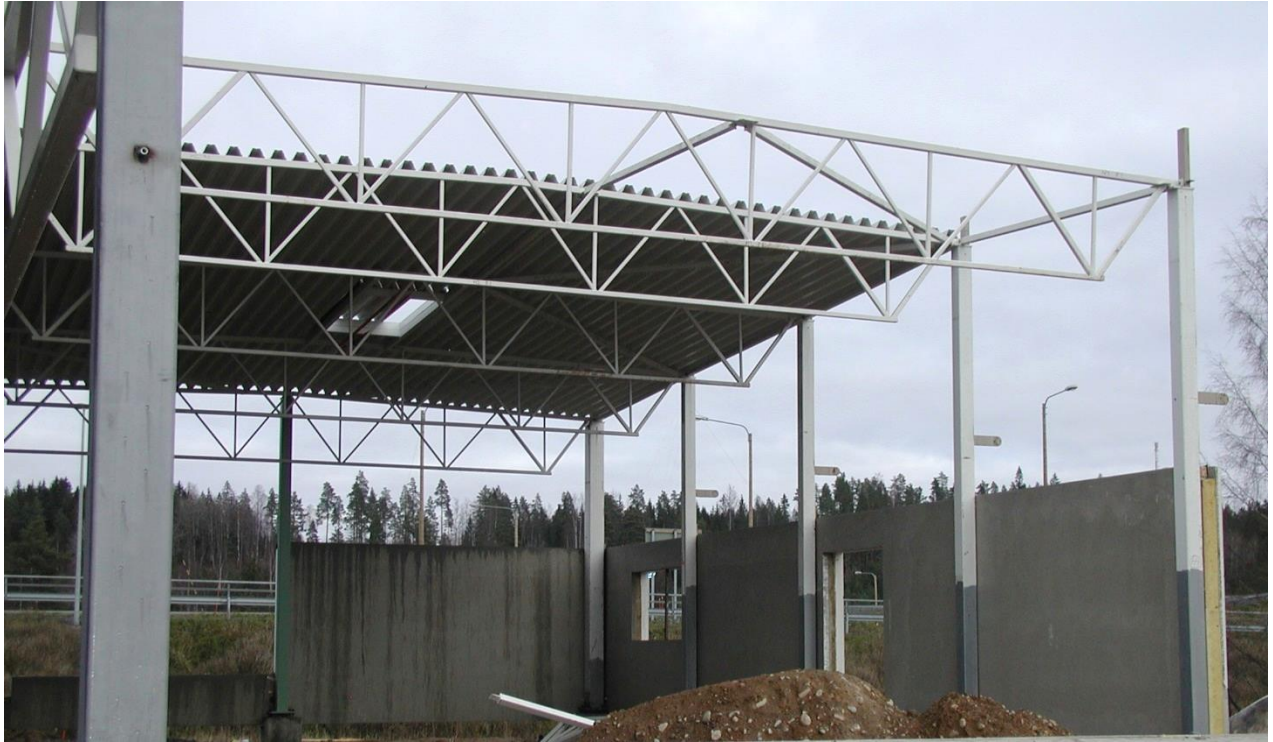
Kuva 2. Runkorakenteiden asennusta uuteen käyttökohteeseen [3].